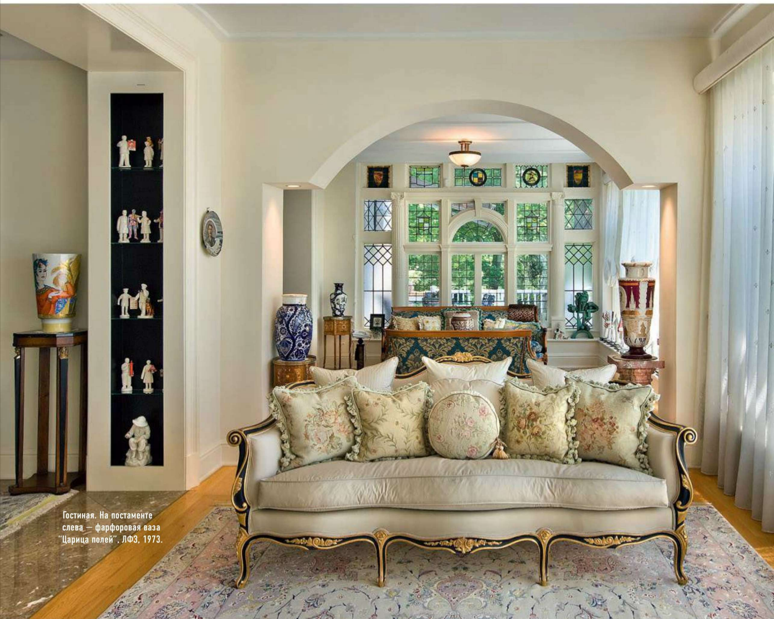
Гостиная. На постаменте слева — фарфоровая ваза "Царица полей", ЛФЗ, 1973.