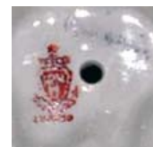
33 Дулево. 1937–1946 год. «Парадная» печатная надглазурная марка черным, красным и синим. Кат. № 140 * Андреева 2004, с. 231, № 45; Сامةцкая 2004, с. 475, № 12 Dulevo special (paradnaia) mark, established 1937, in use to 1946; cat. 140