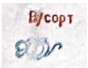
15 Производственная метка изделий высшего сорта в сочетании с маркой «ЛФЗ». 1950–1970-е. Кат. № 87 LFZ quality mark, V/sort for “highest quality,” 1950s-1970s; cat 87