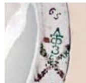
27 Дмитровский фарфоровый завод. 1955 – начало 1960-х. Печатная надглазурная марка. Вариант. Кат. № 189 Dmitrovsk mark, about 1955 to ca. early 1960s, green for second sort; cat. 189